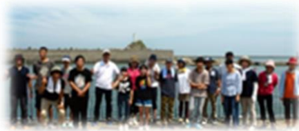
合同体験活動(魚釣り)