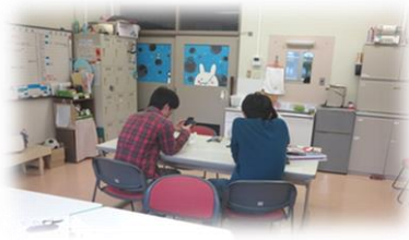
ハートフルスペース