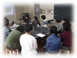
就労に向けた座談会