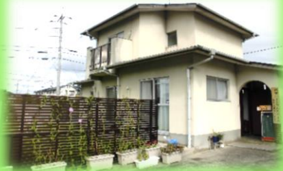
西部ハートフルスペース