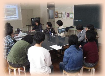
就労に向けた座談会