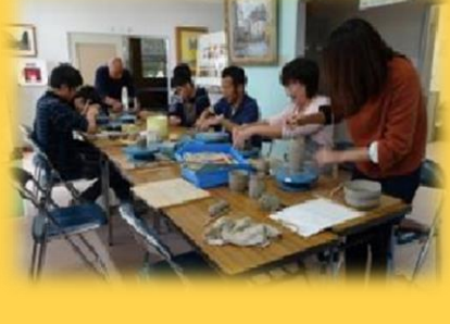
陶芸活動「手びねり」