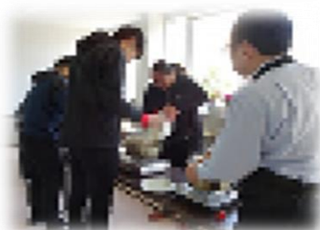
カレーライスパーティー