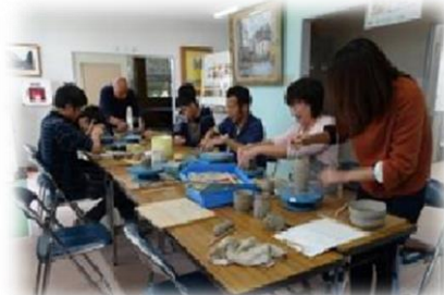
陶芸活動「手びねり」の工程中