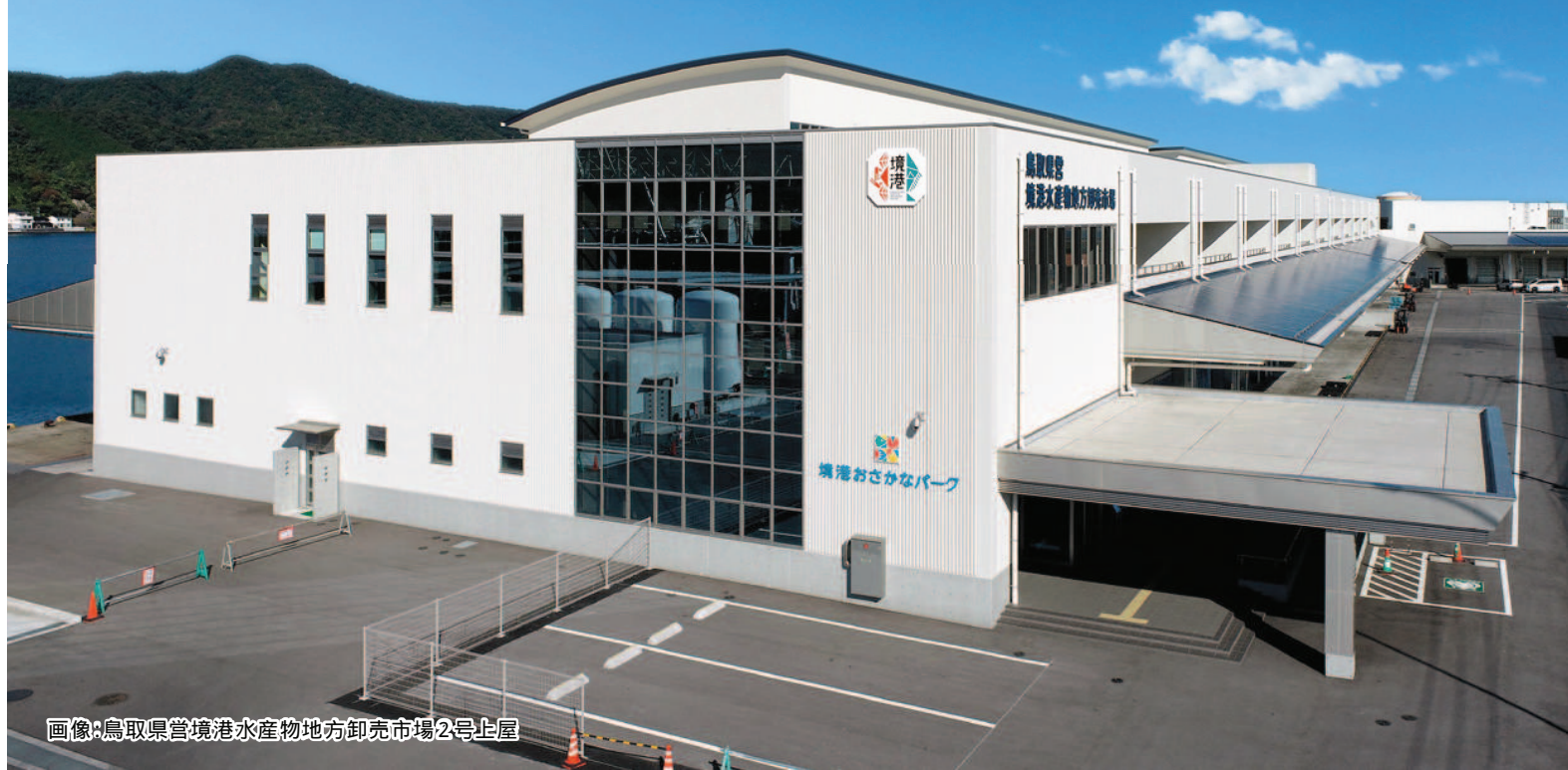
画像:鳥取県営境港水産物地方卸売市場2号上屋