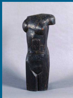
左/ 清田雄司「鳥取 田後漁村」1976年、木版画 中/ 松田晃八「東浜風景」1960年、油彩 右/ 山本兼文「トルソ」1954年、木彫