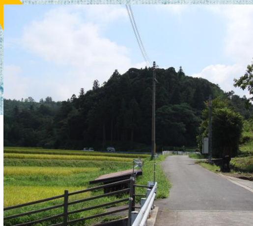
金突橋から小松城をのぞむ