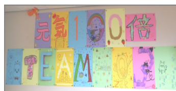
(子どもの思いがあふれる学級目標)

(「元気いっぱい 園・学校づくりのポイント集Ⅱ P.51」 鳥取県教育委員会事務局東部教育局発行 より)