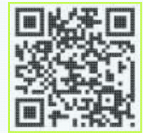
▲川の水位情報QRコード▲