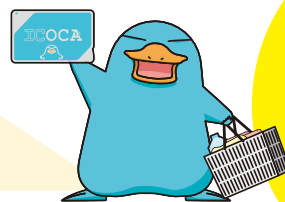
カモノハシのイコちゃん