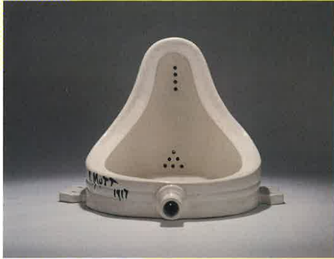
マルセル・デュシャン(泉)1917/64年 小便器(磁器)/レディメイド(シュヴァルツ版 ed.6/6) 京都国立近代美術館蔵 ©Association Marcel Duchamp / ADAGP, Paris & JASPAR, Tokyo, 2019 C2642