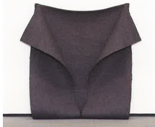
ロバート・モリス(無題)1972年 フェルト 滋賀県立近代美術館蔵 ©2019 Robert Morris / ARS, NY / JASPAR, Tokyo C2645