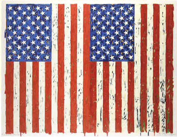
ジャスパール・ジョンズ(旗)1973年 リトグラフ 紙 滋賀県立近代美術館蔵 ©Jaspar Johns/VAGA at ARS, NY/JASPAR, Tokyo 2019 C2641