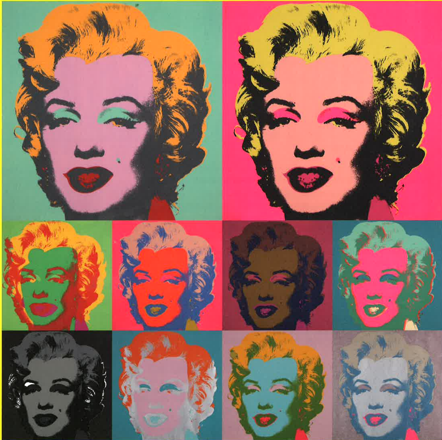
アンディ・ウォーホル「マリリン」1967年