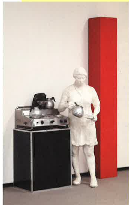
ジョージ・セガル(コーヒーを注ぐエイリス)1973年 石膏、木、金属、磁器、プラスチック 滋賀県立近代美術館蔵

今回の展覧会では現在改修のため休館中の滋賀県立近代美術館が所蔵する日本屈指の戦後アメリカ美術のコレクションを中心に、国内に所蔵されるアメリカ美術の優品を加え、100点余りの作品でアメリカ美術の半世紀、「アメリカ美術の勝利」を概観いたします。