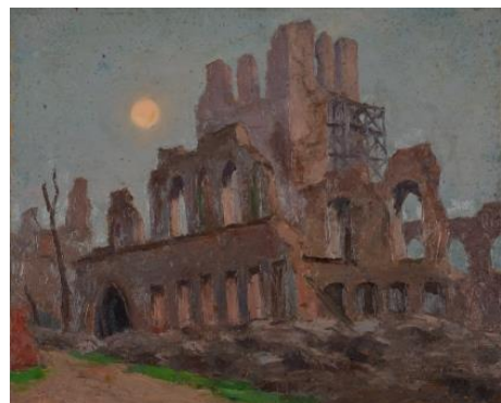
3 香田勝太 《イーブル》