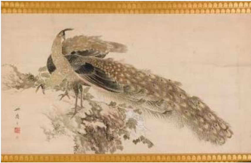
1 土方稻嶺 《牡丹孔雀図》