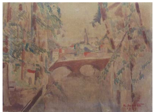
4 前田寛治 《フランス風景》