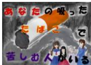
※県内禁煙イベント受賞作品