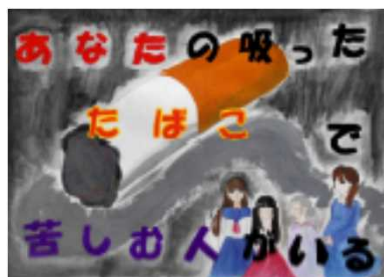
※県内禁煙イベント受賞作品