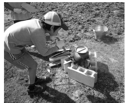
土器炊飯に挑戦する参加者