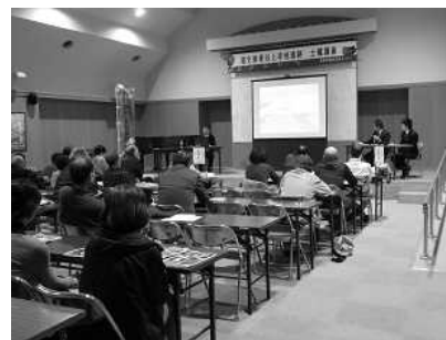
トークセッション