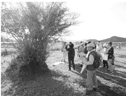
古代の庭園跡「弁天島」解説

国史跡因幡国庁跡、弁天島(国司の館の庭園跡)を中心に古代都市因幡国府の推定エリアをセンター職員の解説付でウォーキングした。