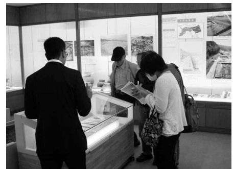
展示室での出土品解説