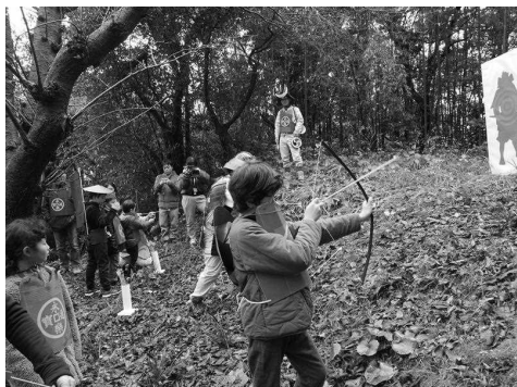
天神山城跡曲輪での攻防体験