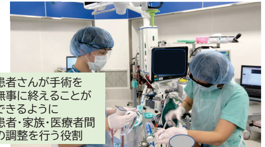
患者さんが手術を 無事に終わることが できるように 患者・家族・医療者間 の調整を行う役割