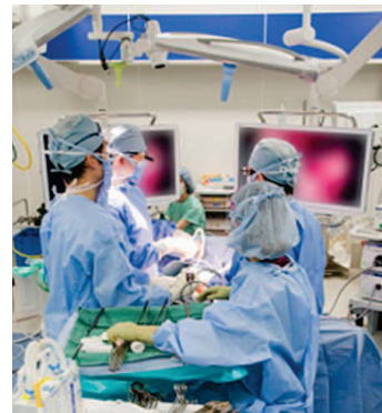
術式や手術器械を理解し、術者へ迅速で 正確に器械を出す役割