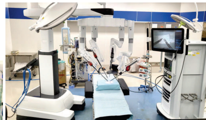
2024年12月に2台目となる 手術ロボットが導入となりました