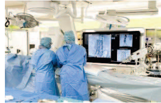
開心術や低侵襲血管内治療を行います