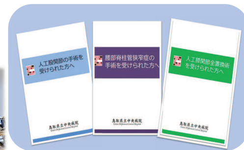
部署作成のパンフレット