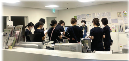
その日の処置や点滴などを確認している様子