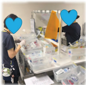
点滴の準備中の様子