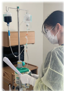
化学療法の点滴投与の様子