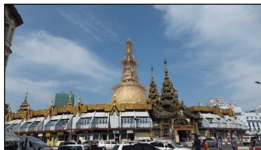
街中にそびえるパゴダ（仏塔）

今回は、タイの西側で50年間続いた軍事政権からの民政移管が2011年に実現、国際社会への復帰を果たし、経済成長が有望視される国家へと変貌をとげたミャンマーについてご紹介します。