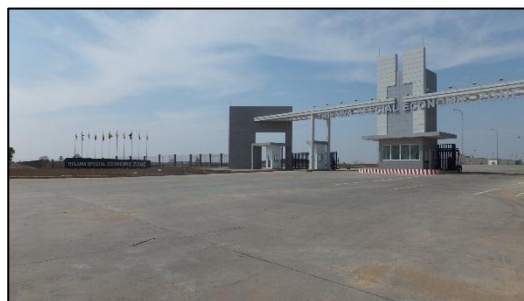
ティラワ工業団地

2013年秋以降、三菱商事、丸紅、住友商事の3社、国際協力機構（JICA）、ミャンマー政府、ミャンマー主要企業などが共同出資する開発会社が、造成を進めてきたティラワ工業団地（ヤンゴンの南東約20キロメートルに立地。面積は約400ヘクタール）が、2015年9月に開業しました。これは発電所などの周辺インフラを完備したミャンマー初の大規模工業団地となります。一帯が経済特区（SEZ）に指定され、投資許可手続きなども簡便になるため今後、日系製造業はティラワでの進出が増加すると考えられます。