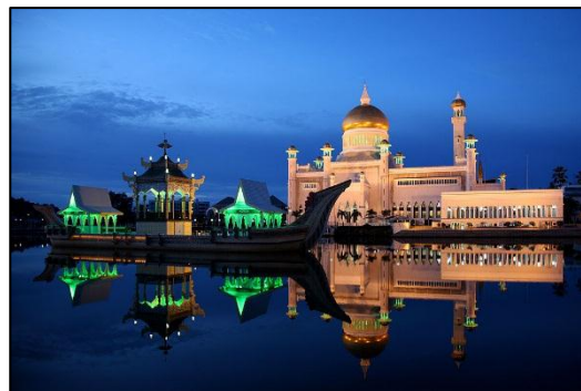
ブルネイの首都バンドルスリブガワンにある 王立モスク

昨年4月から毎月ASEAN加盟国をご紹介させていただいてきましたが、今月でいよいよ加盟10カ国の最後となりました。一般的にはあまり知られていませんが、日本のLNG（液化天然ガス）輸入量5%の供給国であり、皇室・王室間の交流や青少年交流も活発に行われ、長年日本との良好な二国間関係を築いてきた国、ブルネイについてご紹介させていただきます。