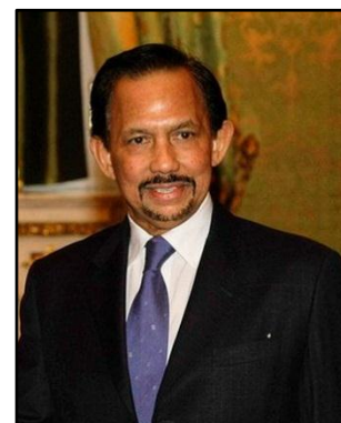
ハサナル・ボルキア国王

経済の大部分（GDP の約 57%）、輸出の約 93%を石油・天然ガスが占めているため、2008年、2009年には世界金融危機により資源価格が大幅に下落し、経済成長がマイナスに落ち込みました。その後も石油、天然ガスの価格に経済が大きく左右され、近年でもマイナス成長が続いているため、ブルネイ政府はエネルギー資源依存からの脱却を図るべく、産業の多様化を推進しています。2006年に石油・天然ガスを原料としたメタノール製造工場を設立、また 2010年には三菱商事がシャープ、三洋電機など 5社 6種類の太陽光パネルを使用した再生可能エネルギーの実証施設を建設、食品分野ではハラフード（イスラム教の戒律に沿った食品）の製造・輸出に力を入れています。