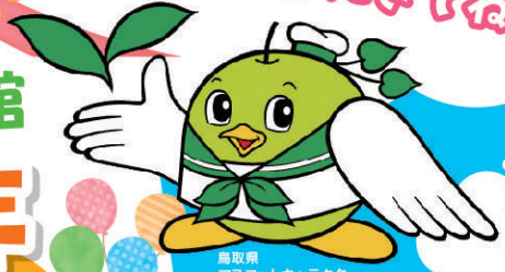
鳥取県 マスコットキャラクター エコトリッピー