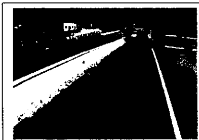
【尾原処理区の道路隆起】