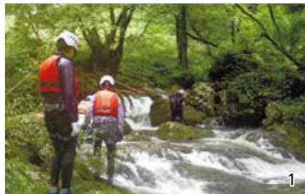
1)ワサビ谷のシャワークライミングは子どもも大人も楽しめる。2)さじアストロパークのコテージ。3)コテージには本格的な天体望遠鏡を完備。4)梨の木一本に300~400個の実をつける。5)鳥取を代表する特産品の「二十世紀梨」は、生産量も日本一を誇る