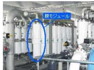
鳥取市水道局イメージ