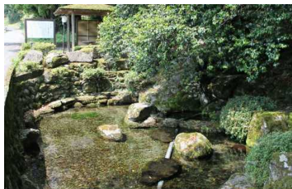
布施の清水イメージ