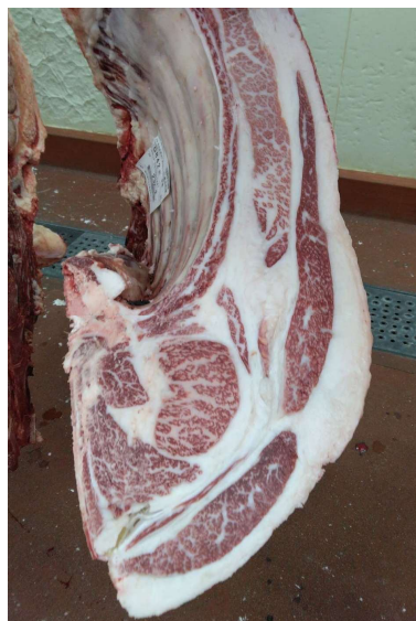
雌(百合85の3×白鵬85の3×百合茂) BMSNo.7, ロース芯58cm