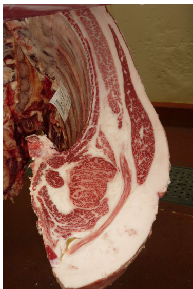
雌(百合85の3×第1花藤×百合茂) BMSNo.8, ロース芯63cm