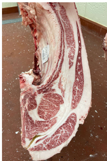
去勢(百合85の3×安福久×勝忠平) BMSNo.9, ロース芯66cm