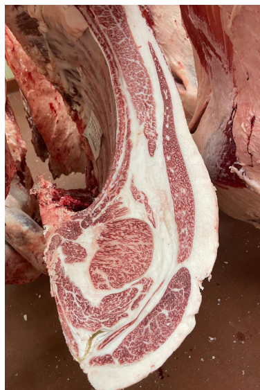
雌(百合85の3×隆之国×安平安) BMSNo.11, ロース芯75cm