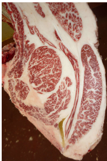
去勢(百合85の3×白鵬85の3×勝忠平) BMSNo.7, ロース芯53cm