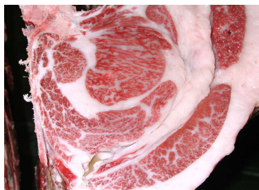
雌(百合85の3×光平照×百合茂) BMSNo.7, ロース芯62cm