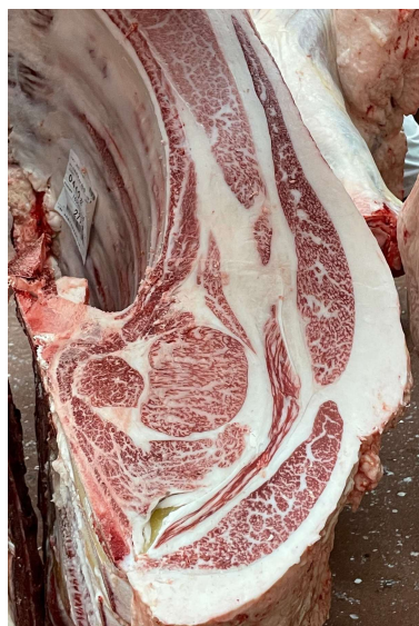
去勢(百合85の3×勝忠平×福之国) BMSNo.11, ロース芯64cm