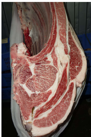
去勢(百合85の3×美国桜×百合茂) BMSNo.12, ロース芯77cm