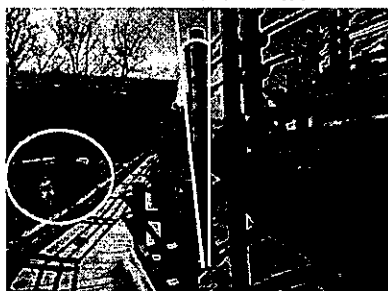
スロープの傾き・手すりの破損状況