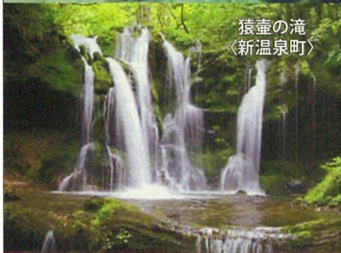
猿壺の滝 〈新温泉町〉