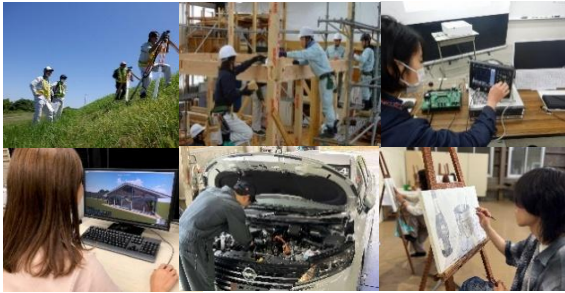
職業訓練@産業人材育成センター