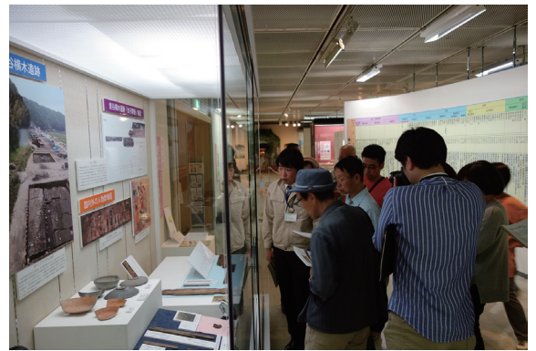
ギャラリートークの様子（4月22日）