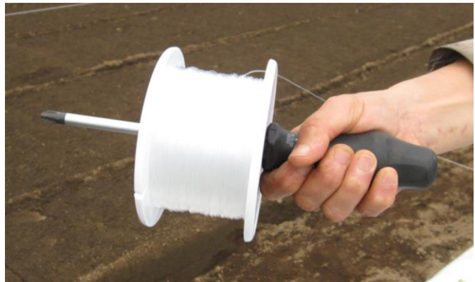
写真4 テグス張りはドライバーを使うと便利