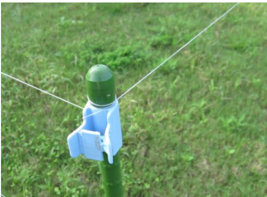
写真3 テグスをパッカーで止める