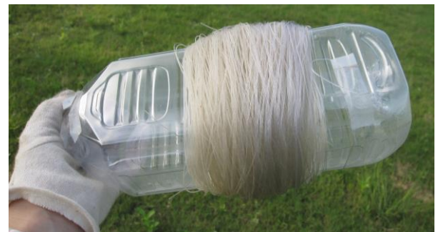
写真7 テグスはペットボトルに巻き取る

テグスはペットボトルに巻き取って回収するとよいです（写真 7）。再び張るときは、ペットボトルの口に適当な長さの太さの棒を差し込めば、繰り出しが容易です。