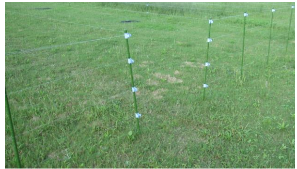
写真6 出入口を設けるとよい

テグスを幅 1m だけ張り残した「出入口」を設けておくと出入りが楽です（写真 6）。