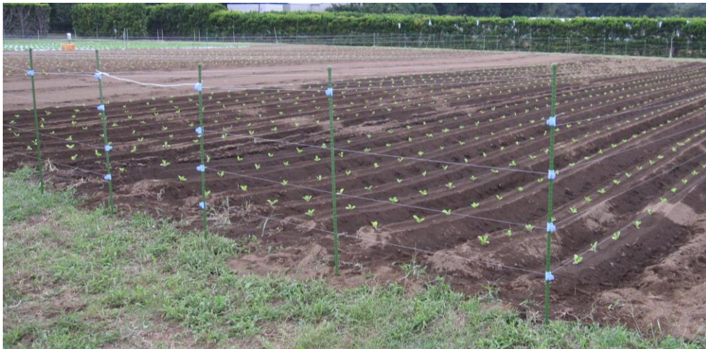
写真1 「畑作テグス君」のハクサイ圃場への設置状況

畑作物のカラス被害対策として、必要なときに短時間で設置し、回収して再利用できるテグス設置方法です。支柱を用いてテグスを圃場上面 1m の高さに 1m 間隔で平行に張り、側面は 25cm 間隔で 4 段のテグスで囲むことで、カラスの侵入を効果的に抑えられます。