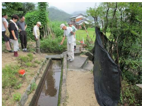
防災マップの作成 (防災まち歩き)