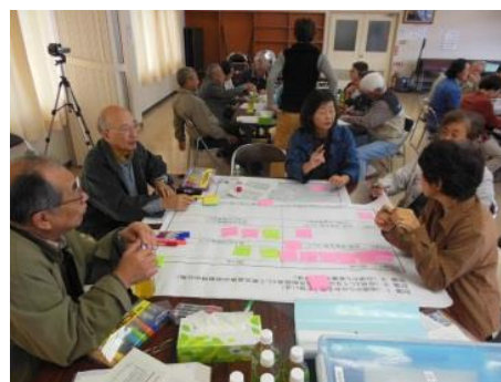
防災ワークショップ (災害図上訓練)