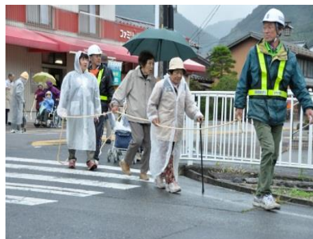
防災訓練のサポート