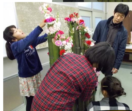
もうすぐ完成です！