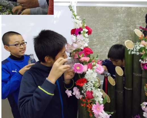
こぼさないよう、慎重に……