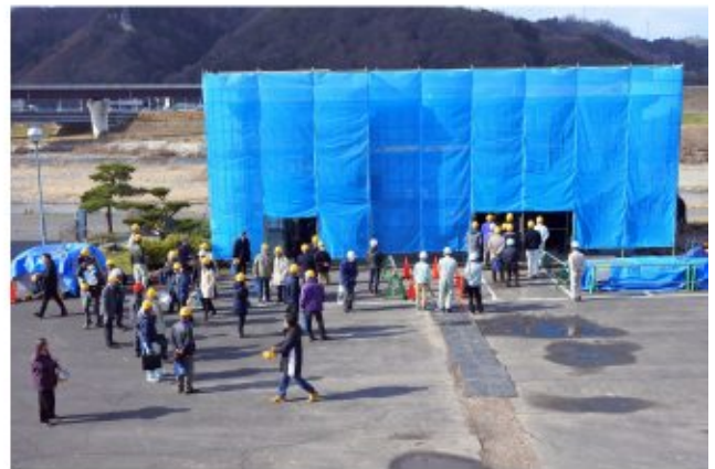
2018/01/23 屋内試験棟構造見学会(H30.1.23)