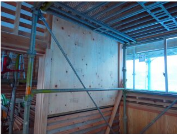
2018/02/06 構造用合板（ヒノキ）耐力壁