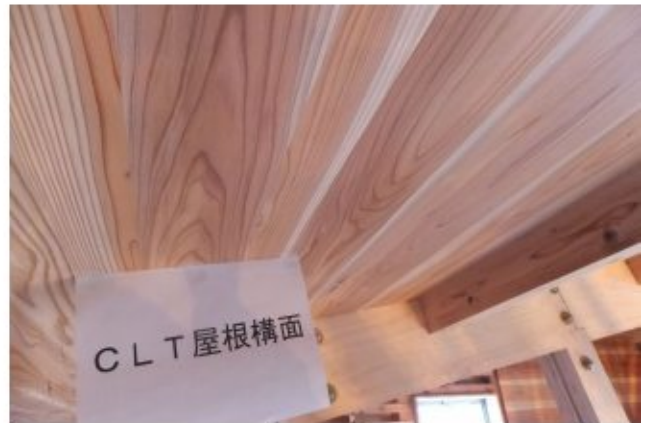
2018/01/23 屋根構面 (スギCLT)