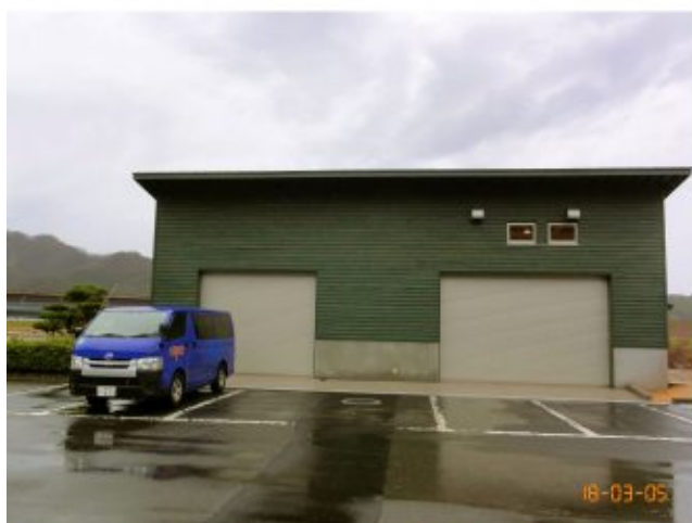
木材環境研究棟（正面） （建物は完成、現在、恒温恒湿室 設置工事中）