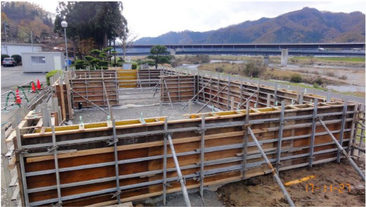
腰壁部型枠組み立て