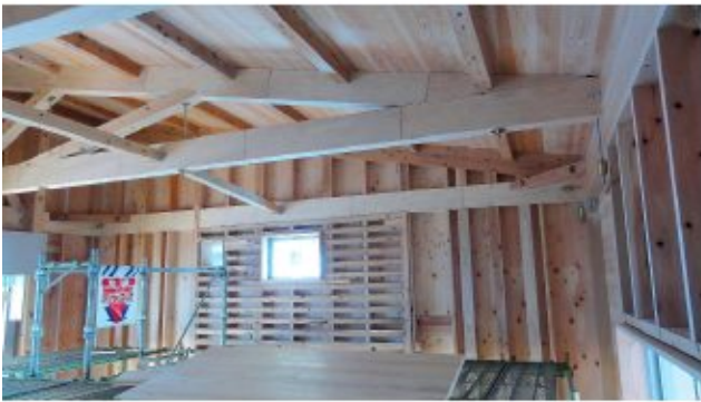
2018/01/19 片流れトラス (ヒノキLVL)