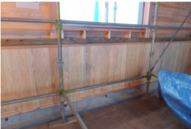
2018/01/23 とっとり杉ごころ