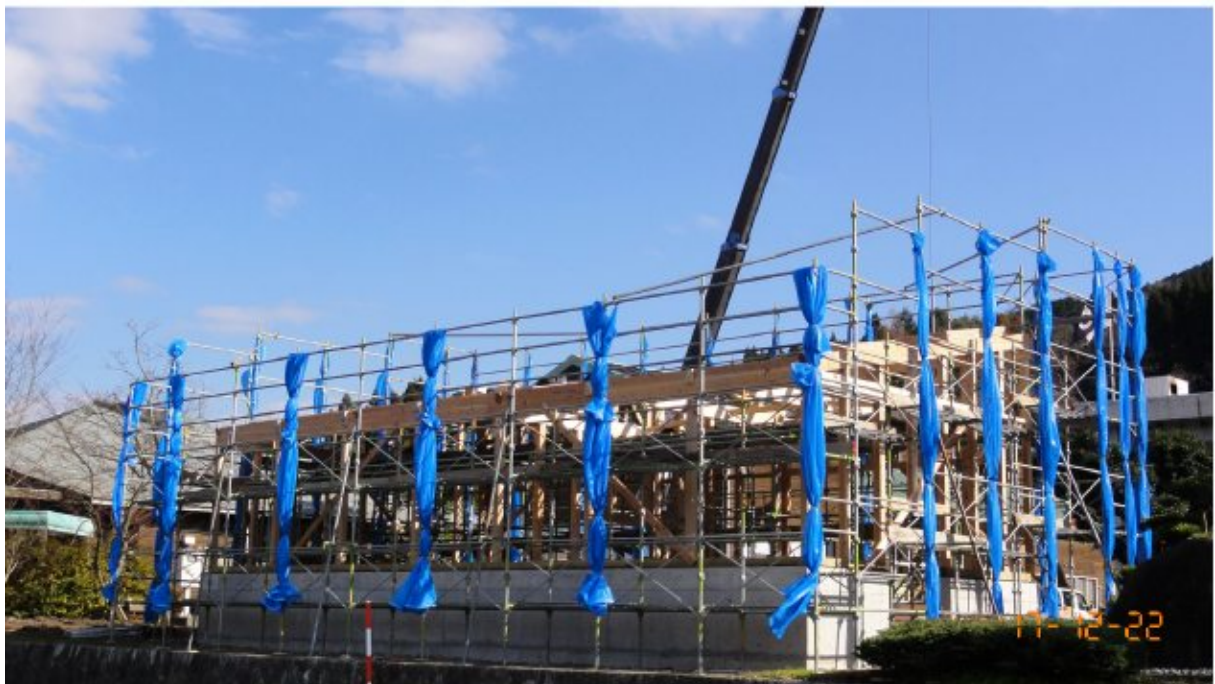
棟上げ中（道路側から）