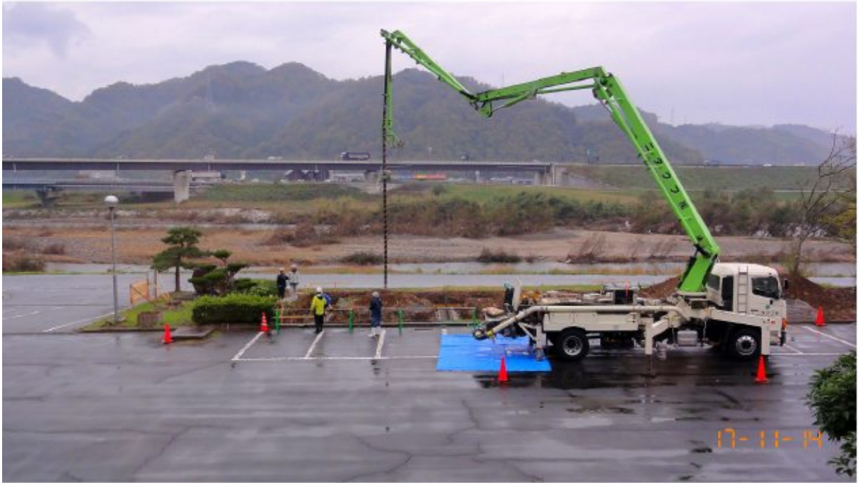
コンクリート打設（ベース）