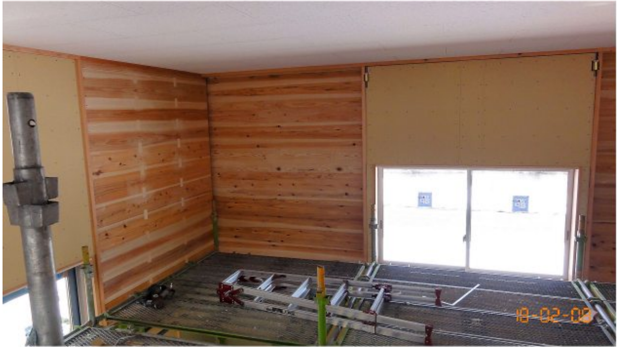
スギ厚板耐力壁とCLT（スギ）耐力壁