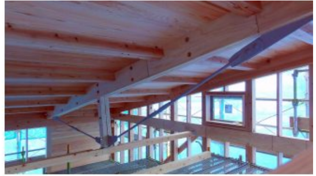
2018/01/10 張弦梁トラス (ヒノキLVL)