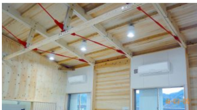
張弦梁トラス（ヒノキLVL）