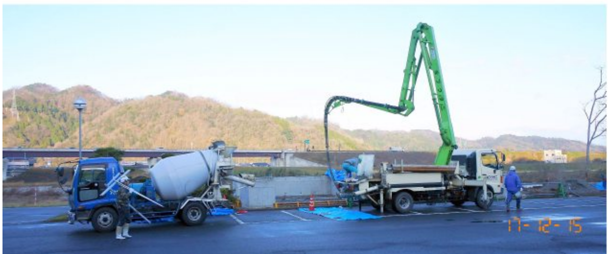
基礎コンクリート打設