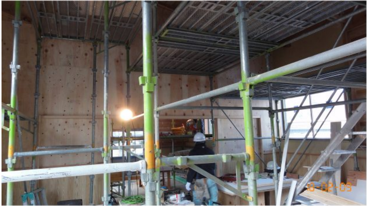
構造用合板（ヒノキ）耐力壁