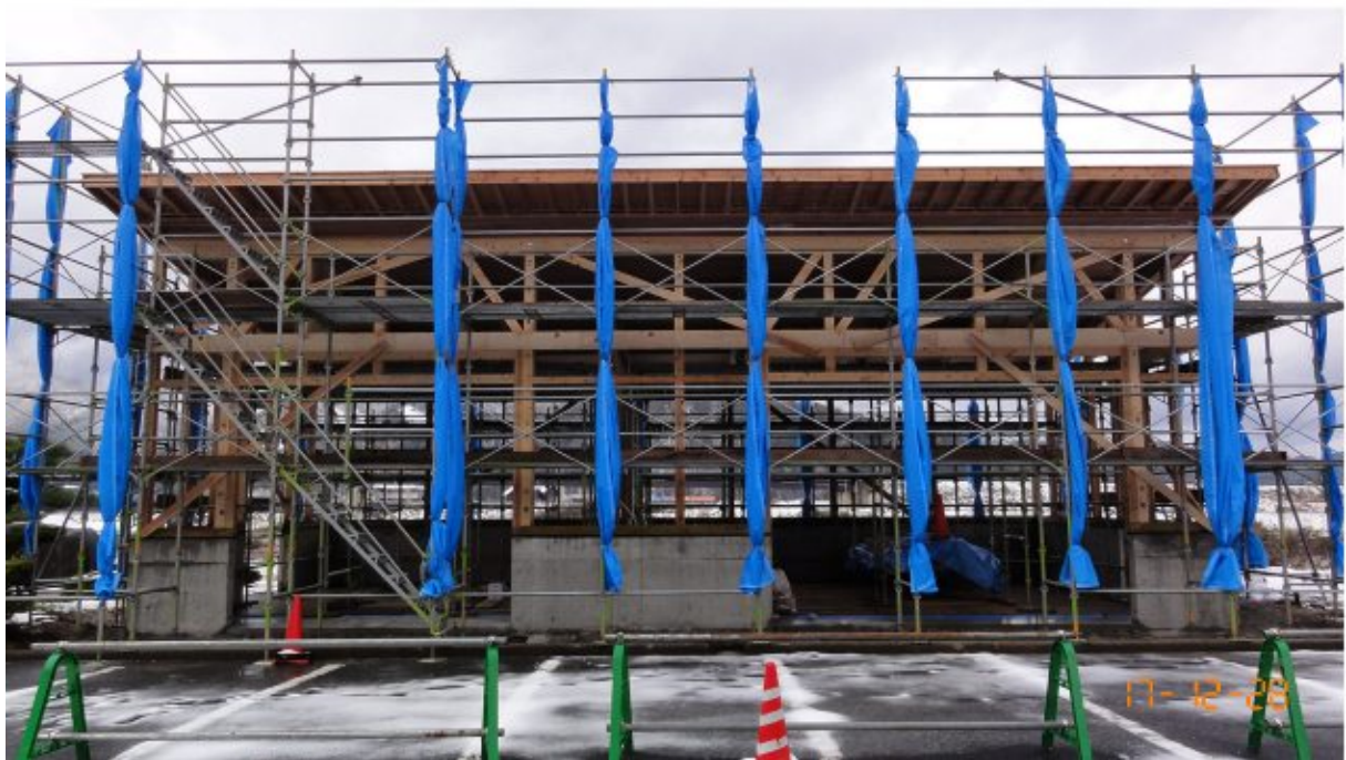
棟上げ完了（29年次内工事完了）