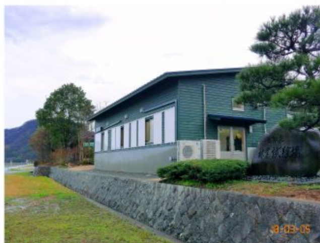
市道側から見た木材環境研究棟