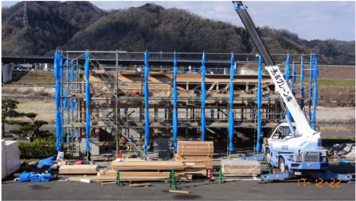
棟上げ中（本館から）