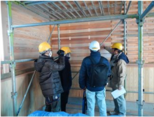
2018/01/23 スギ厚板耐力壁とC L T耐力壁