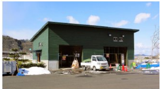
2018/02/06 (H30.2.6現在) 足場撤去後の屋内試験棟