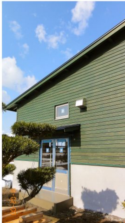
ポーチ床（モルタル金ごて押さえ仕上げ）