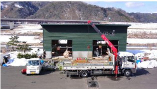
2018/02/06 足場撤去後の屋内試験棟