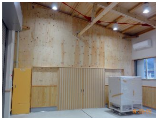
構造用合板（ヒノキ）耐力壁