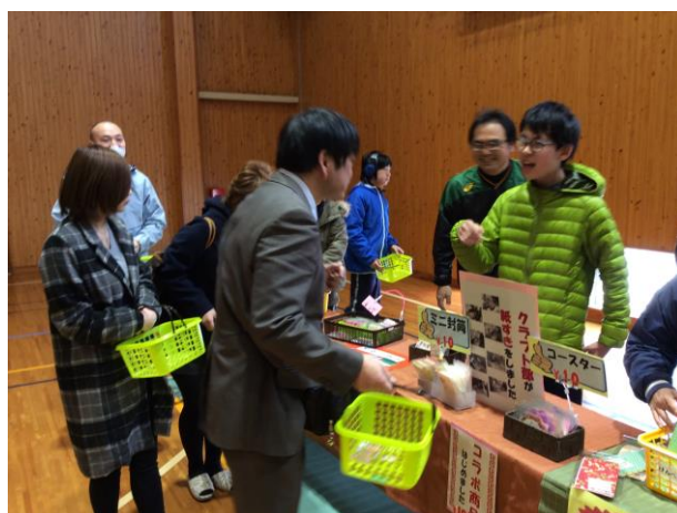
【「ショップスマイル」での販売活動】