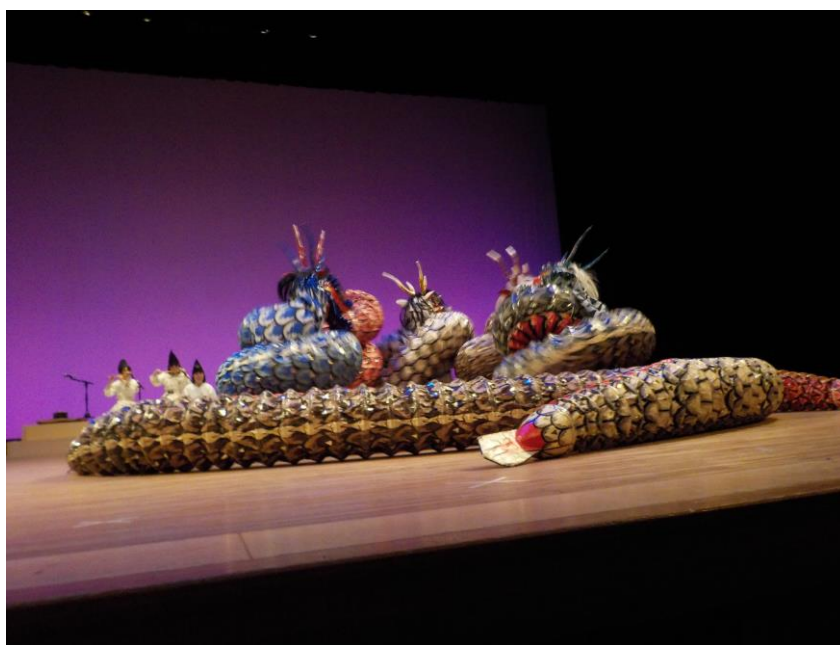
【文化・芸術の継承と発信「荒神神楽」】