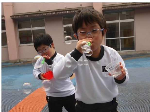
【友だちと一緒にシャボン玉遊び】