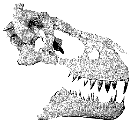
タルボザウルス頭骨