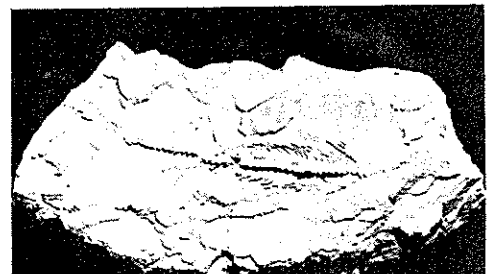
ブラジロサウルス