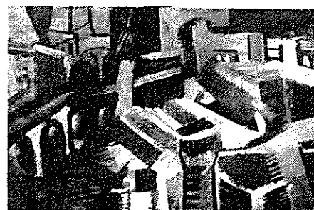
前田寛治作「工場風景」