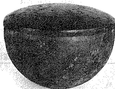
伊福部徳足比賣骨蔵器(レプリカ)