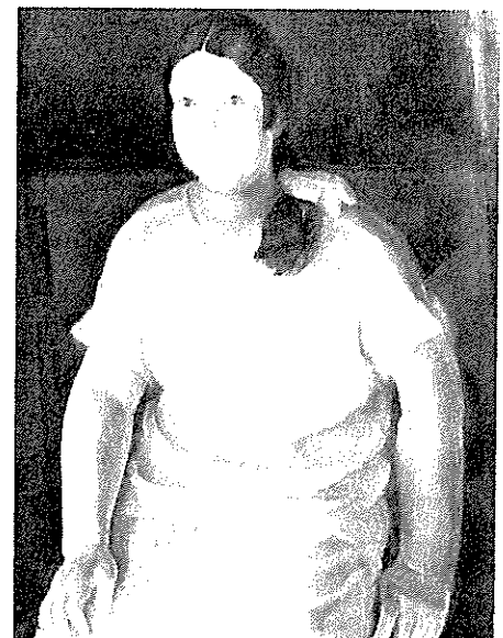
「丁子像」 川上貞夫作