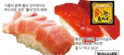
붉은살 185엔, 연푸리살과 뱃살은 공통 360엔. 둘 다 먹고 싶다!