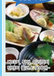
다랑어, 튀김, 이리까지 전량이 폰즈소스 900엔