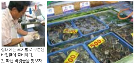
점내에는 크기별로 구분된 바윗굴이 준비되어 있다. 갓 따낸 바윗굴을 맛보자

☞ 돗토리지 아오야초 나가와세1072-5 ◎9:00~18:00 ◎부정기 휴무