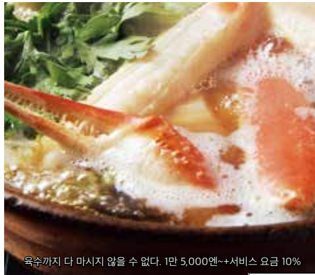
육속까지 다 마시지 않을 수 없다. 1만 5,000엔~+서비스 요금 10%

전국의 게 미식가가 절찬하는 초특선 대게 게 전골 가니요시 ☎0857-22-7738