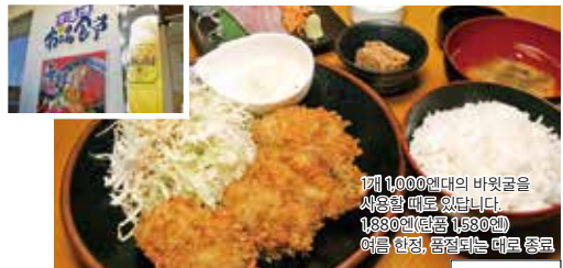
1개 1,000엔대의 바윗굴을 사용할 때로 있습니다. 1,680엔 (전화 1,530엔) 여름 한정, 품절되는 대로 종료

☞ 돗토리지 가로초 기타1-5-36 ◎11:00~14:00, 17:00~19:00 (아간에는 문의 요망) ◎부정기 휴무