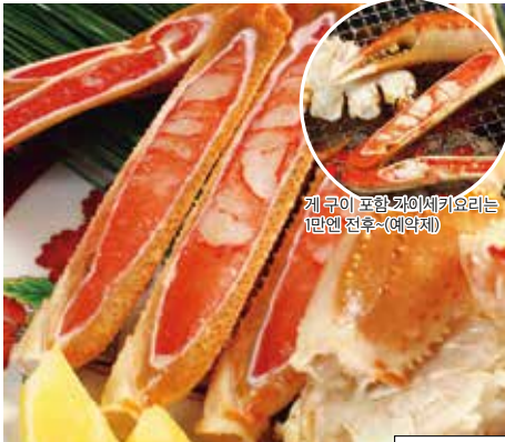
게 구이 포함 카이시키키요리는 1만엔 전용 (예약제)