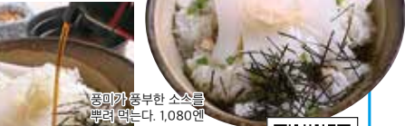
풍미가 풍부한 소스를 뿌려 먹는다. 1,080엔