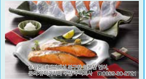
동일본 대지진에서 복구한 일본산 연어, 문의:유미기하마 수산 주식회사 ☎0859-30-2721

2012년부터 전국에 출하되고 있는 새로운 브랜드 생선. 2011년 3월에 발생한 대지진 재해 후에 이와테현에서 구랴오시로 치어를 이동시켜 양식을 시작. 2012년부터는 알에서 치어까지를 명산 다이센의 복류수를 사용하여 담수 양식. 그 후에 미호만의 바다의 거센 파도와 세찬 조류 속에서 6개월간 양식하여 어체에 상처를 입히지 않도록 피시펄프로 이동시켜 1마리씩 신선한 상태로 출하. 발군의 신선도와 짙한 살 그리고 적당히 오른 기름으로 돗토리현 내 음식점에서도 생선회사 덮밥으로 호평이다.