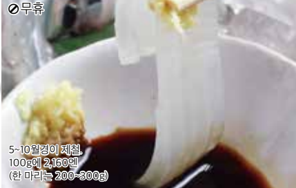
5~10월경이 제철 100g에 2100엔 (한마리는 200~300g)

오징어 미식가가 좋아하는 '한마리 회'. 식감이 일품인 투명한 살은 활어조에서 꺼내어 1~2분만에 회를 뜬 장인 기술의 정수, 단맛이 우러나는 회간장과 생강을 곁들여 행복한 순간을. 오징어 다리과 귀는 튀김과 소금구이 중에서 선택할 수 있다. ☞ 돗토리지 가로초 니시3-27-1 ◎11:00~15:00, 17:00~22:00 (최종 주문시간 21:00) ◎무휴