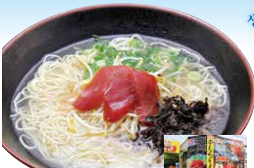
다랑어절인과 돌김을 곱명으로 얹은 라멘으로 바다의 맛을 느껴라. 918엔