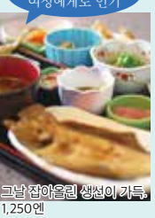
그날 잡아올린 생선의 가득, 1,250엔