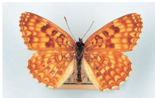
写真 4. ウスイロヒョウモンモドキ Melitaea protomeadia protomeadia < CR+EN > (1964 年 7 月 5 日 西伯郡伯耆町榎水高原)