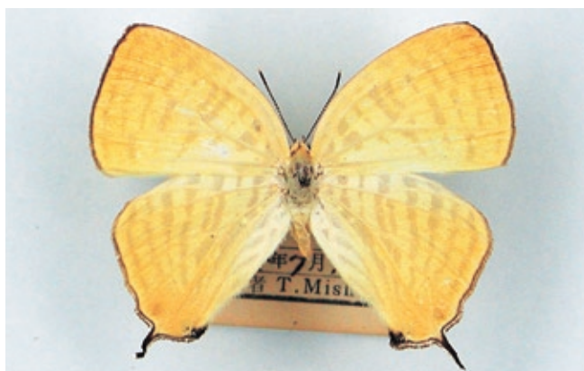
写真 3. ウラナミアカシジミ Japonica saepestriata < CR+EN > (1970 年 7 月 19 日 日野郡江府町下蚊屋)