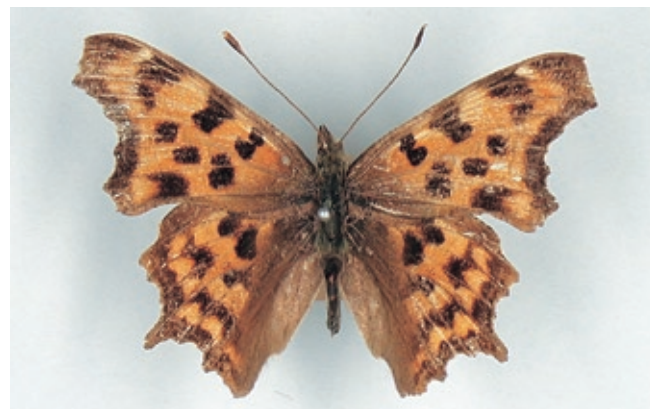
写真 2. シータテハ Polygonia c-album hamigera < EX > (1960 年 8 月 5 日 西伯郡大山町大山寺)