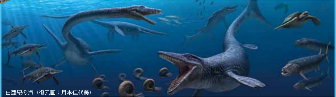
白亜紀の海 (復元画: 月本佳代美)