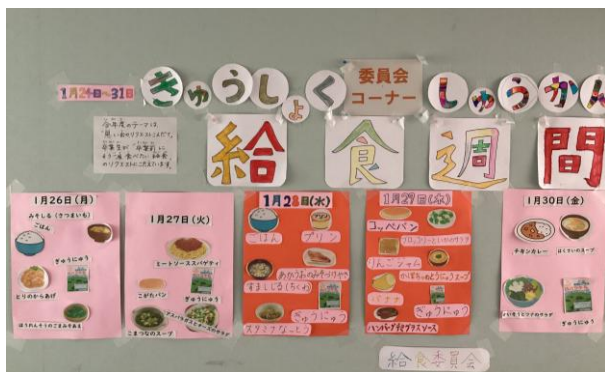
「思い出のリクエスト献立」の紹介