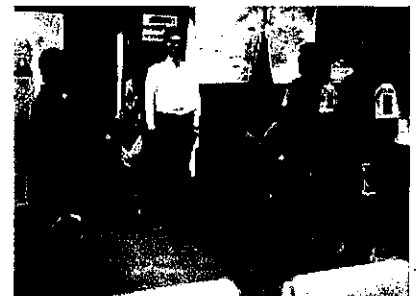
(特別派遣部隊の入県申告状況)