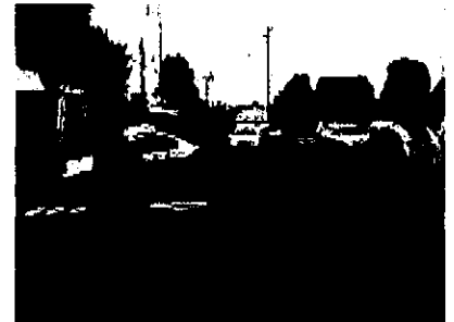
(特別派遣部隊の入県状況)