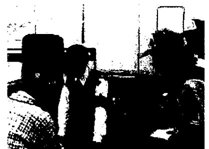
(おしどり隊員による避難所訪問)