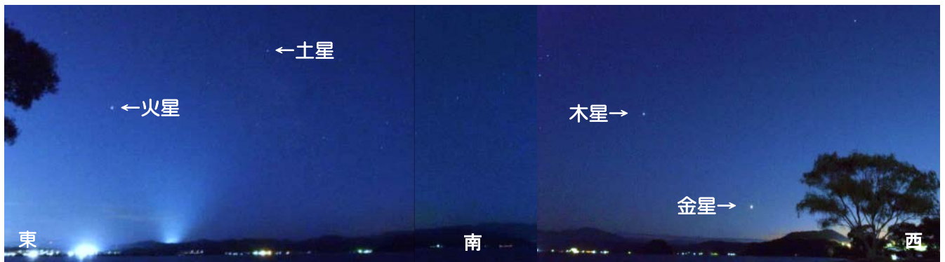
【夕方頃に見られる4つの惑星 (2018年9月3日湖山池で撮影)】

今年の夏は、県内各地で多くの天体観望会が開催されました。さすが、 星取県 です。観望会では、今年火星が大接近する年なので、多くの方が大接近中の火星を観察されたようです。7月31日が最接近の日でしたが、当館では8月4日に天体観望会「ジオパークの星空観望会」を開催し、火星をはじめとする4つの惑星(金星、火星、木星、土星)を観察しました。夕方頃から徐々に星が見えはじめますが、惑星は明るいため、星座の星が見えはじめるよりも早く夜空に輝き始めます。特に、金星は非常に明るく、西の空に真っ先に見つけられる星です。金星よりも少し南側の高度の高い位置に、木星が輝いています。土星は、夕方頃はわかりにくいかもしれませんが、1等星よりも明るいので、辺りが暗くなると天の川の中に輝いているのがわかります。火星は、東の空にオレンジ色に輝いているので、すぐに見つけられます。