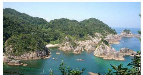
【花こう岩でできた浦富海岸】

浦富海岸は、花こう岩が日本海の荒波に削られてできた海食地形が、美しい景観を作り出している海岸です。花こう岩は、マグマが地下深くでゆっくり冷え固まってできる岩石ですが、花こう岩となるためには、花こう岩と同じような化学組成を持つマグマの存在が必要です。