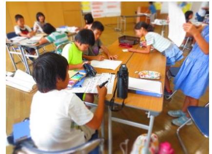
▲タイトル、割り付けの決定～断裁