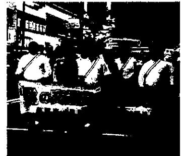
【交通安全パレード】