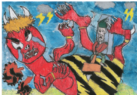
絵画・デザイン部門 「お話の絵～せいやあ～」 高橋 大稀