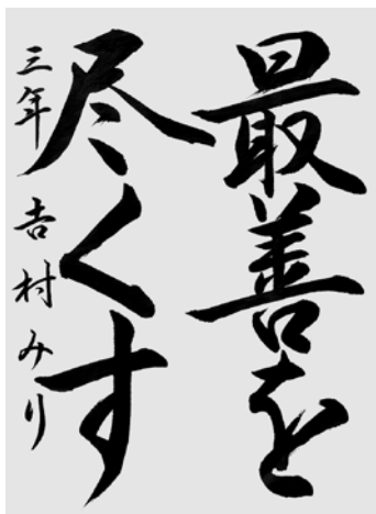
書写部門 「最善を尽くす」 吉村 みり