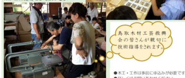
糸ノコの指導もして頂けるよ