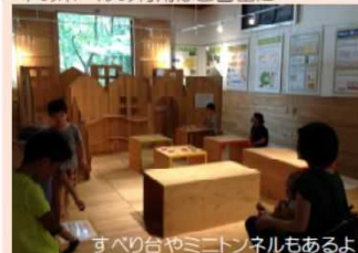
すべり台やミニトンネルもあるよ