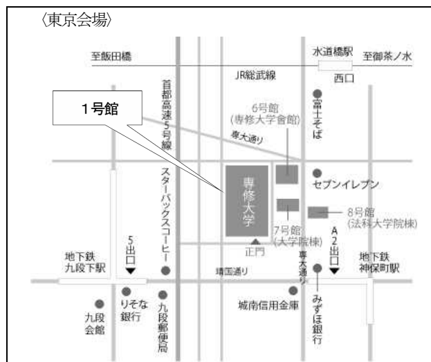
水道橋駅（JR）西口より徒歩約7分 九段下駅（地下鉄／東西線、都営新宿線、半蔵門線） 出口5より徒歩約3分 神保町駅（地下鉄／都営三田線、都営新宿線、半蔵門線） 出口A2より徒歩約3分