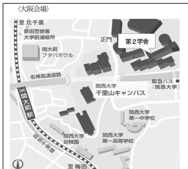
阪急電鉄関大前駅より徒歩約10分

公共交通機関で県内の試験会場へご来場の際は、携帯電話やパソコンから出発地・目的地を入力するだけで最も便利な経路（バス路線、乗車・下車する駅・バス停等）が最新ダイヤの運行時刻付きで表示される「バスネット」（ http://www.ikisaki.jp ）が便利ですのでご利用ください。