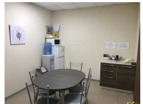
商談スペース用の会議室